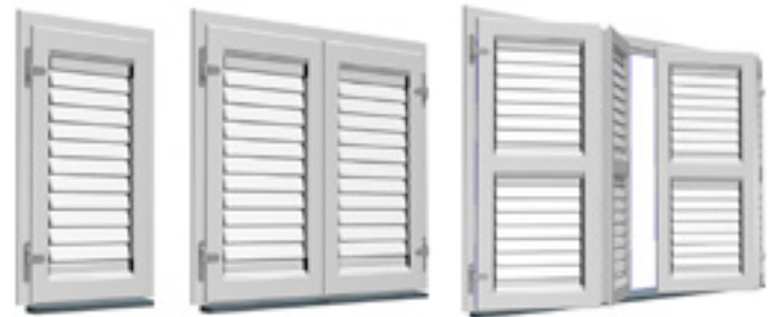
Mallorquina Kiuzo de cuatro hojas plegables