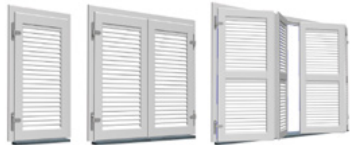
Mallorquina Kiuzo de una hoja